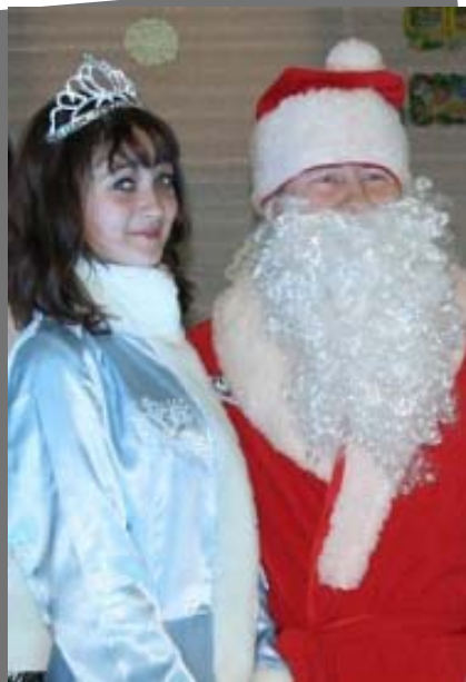
Сюрпризом для всех стало появление в конце вечера декана ФИОТ в роли Деда Мороза