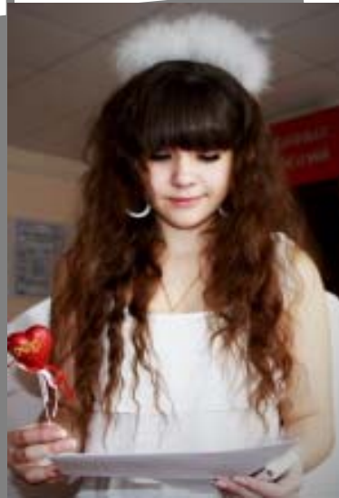
Костюмы организаторов никого не оставили равнодушными

14 февраля - по календарю День всех влюбленных - в этом году прошел очень оригинально для всего Студенческого совета ФИОТ.